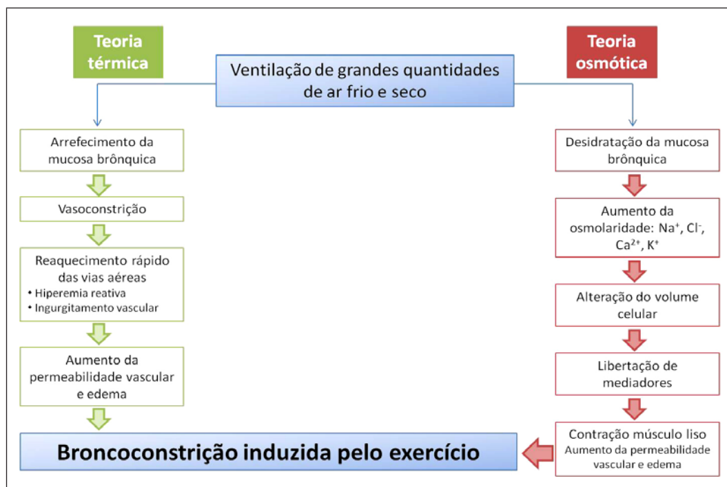
Figura 2. Teorias clássicas explicativas da ocorrência de asma/broncoconstrição induzida pelo exercício

Os mecanismos clássicos subjacentes à AIE incluem as hipóteses: 1) osmótica, por desidratação das vias aéreas; 2) térmica, por perda de calor das vias aéreas 2,21-23 . Devido à elevada ventilação que ocorre durante o exercício, existe inalação de ar frio e seco, que provoca a evaporação da água da superfície das vias aéreas, resultando em contração celular e libertação de mediadores inflamatórios que causam a contração do músculo liso (Figura 2) 2,21-23 .