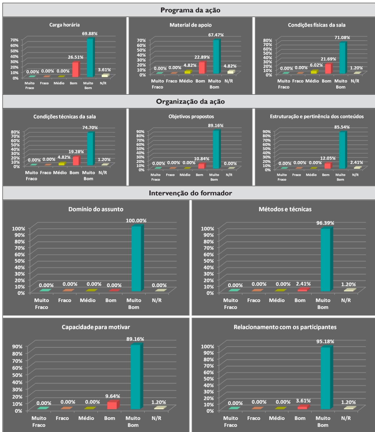
Figura 5. Respostas dos formandos ao questionário do final da ação