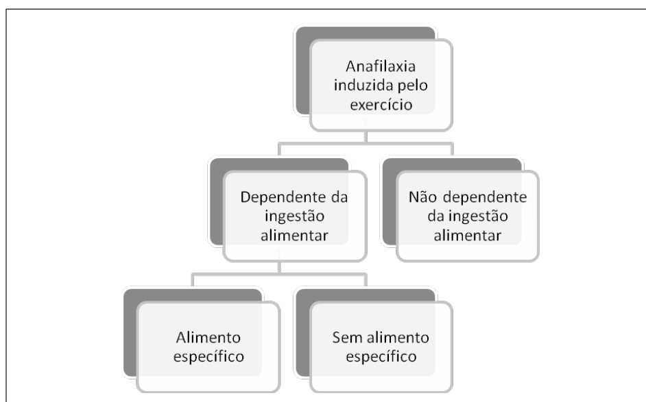
Figura 3. Classificação da anafilaxia induzida pelo exercício

intramuscular na face ântero-lateral da coxa o mais precocemente possível, seguida de anti-histamínicos, corticosteroides e eventualmente broncodilatadores. O doente deve ser colocado em decúbito e com elevação dos membros inferiores 42 . É aconselhada a suspensão imediata da atividade física aos primeiros sintomas de reação, pelo que o reconhecimento precoce das manifestações prodrómicas (prurido, rubor ou sensação de calor) por parte do doente é muito importante. No entanto, o objetivo principal é a prevenção da ocorrência dos episódios. Não existem fármacos que previnam adequadamente a anafilaxia, pelo que o reconhecimento dos sintomas, a educação do doente e acompanhantes, bem como a identificação pelo médico dos fatores desencadeantes são fundamentais. O conhecimento dos fatores desencadeantes é o ponto fundamental para uma estratégia preventiva adequada. Nesse sentido, a orientação precoce para uma consulta de Imunoalergologia é fundamental. Nos casos em que a AnIE se associa a ingestão alimentar, deve-se evitar refeições nas 4-6 horas anteriores e 1 hora após a prática de desporto. Além disso, deverão ser evitados também cofatores, como a toma de medicamentos ou álcool. A modificação do regime do exercício, com menor duração e intensidade, a limitação do exercício em dias quentes e